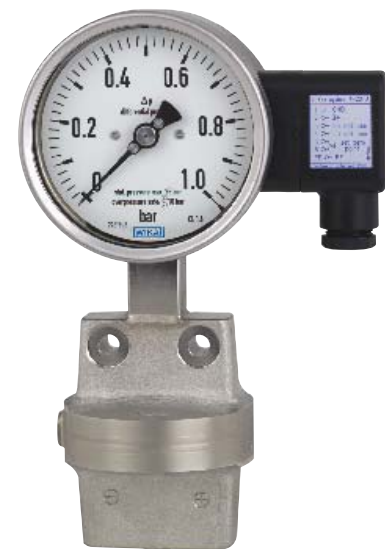
INTELLiGauge Модель DPGT43.100

Данный дифманометр производится по EN 837-3 из хромоникелевой стали с высокой коррозионной стойкостью. Измерительные камеры выполнены полностью металлическими, без полимерных уплотнений,